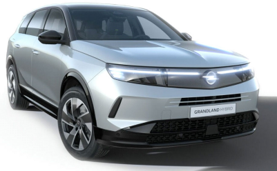
Kristall ezüst (metálfényezés)