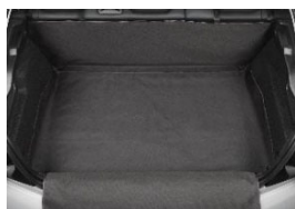
Csomagtartó burkolat (vinil lökhárító védelemmel)