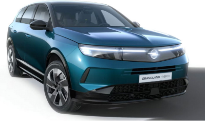
Spektrum zöld (metálfényezés)