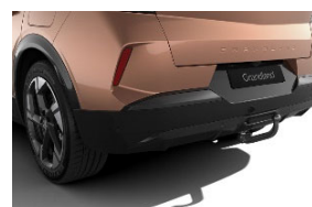
Szerszám nélkül leszerelhető vonóhorog 13 pólusú csatlakozóval