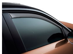
Légterelő első ajtóra, 2db-os szett