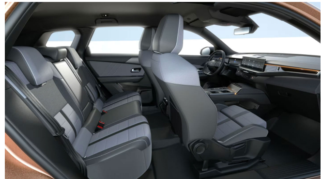
GS kárpit, szövet, sötétszürke/fekete (CBFT)