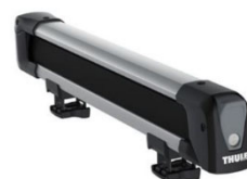
Snowpack 7324 tartó: 4 db síléc / 2 db snowboard