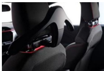
FlexConnect moduláris csatlakozó és vállfa