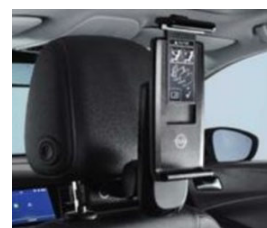
2 univerzális tablet tartó 2 moduláris csatlakozó