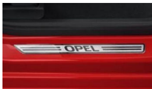
Első alumínium hatású Opel küszöbborítás