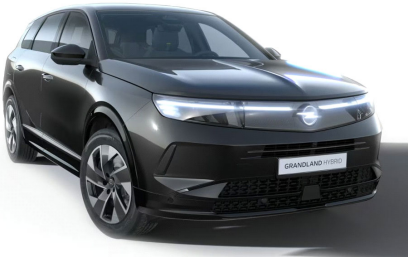
Karbon fekete (metálfényezés)