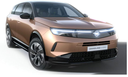
Impakt réz (metálfényezés)