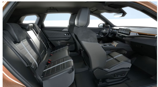
Bőrkárpit, perforált nappabőr, fekete (8BFC)