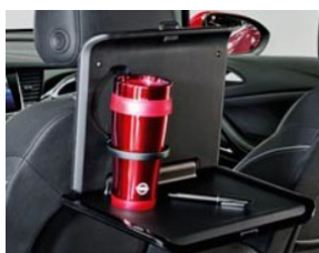
2 pohártartós asztalka 2 moduláris csatlakozó