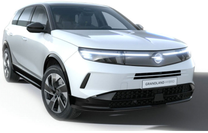
Arktis fehér (alapfényezés)