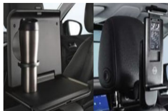
1 asztalka + 1 univerzális tablet tartó + 2 csatlakozó