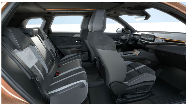
Alcantara kárpit, fekete (1UFX)