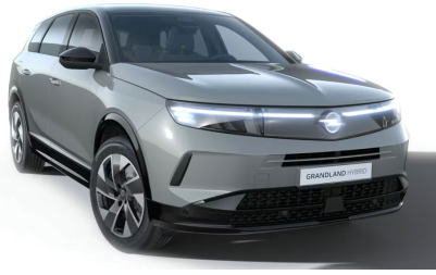
Grafik szürke (alapfényezés)