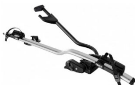
Expert 298 1-db-os kerékpártartó