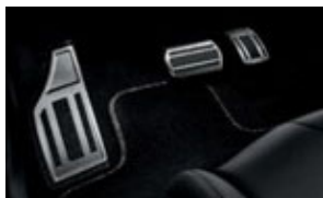
Alumínium pedálborítás, lábpihentetővel