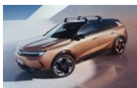
Keresztirányú tetőrudak hosszanti tetősínhez