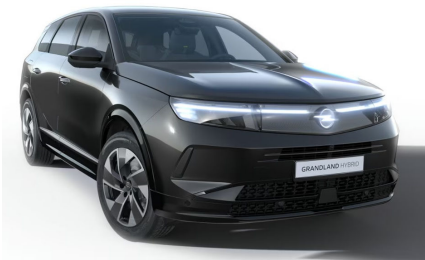
Karbon fekete (metálfényezés)