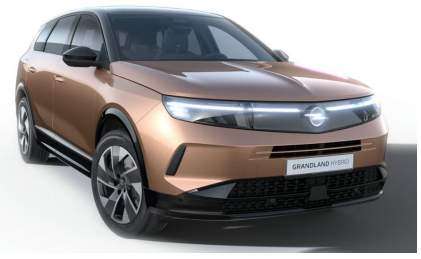
Impakt réz (metálfényezés)