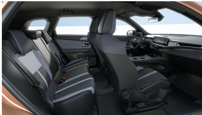
Édition kárpit, szövet, fekete/szürke (CBFR)