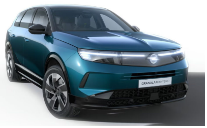
Spektrum zöld (metálfényezés)