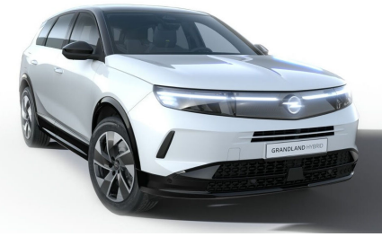
Arktis fehér (alapfényezés)